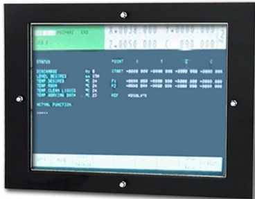
2361116 - doppelte Frontplatte (315 x 236.5 mm)