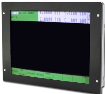
2361119 - Anschluss: 15pol. HD D-Sub

Unser TFT-Industrie-Monitor ersetzt mit einem modernen Konzept ausgediente oder defekte Röhren- bzw. TFT Monitore in AGIE Maschinen. Alle Geräte werden unter Verwendung ausschließlich hochwertiger Komponenten in Deutschland gefertigt. Eine dem Original nachempfundene Mechanik erleichtert den Um- bzw. Einbau.