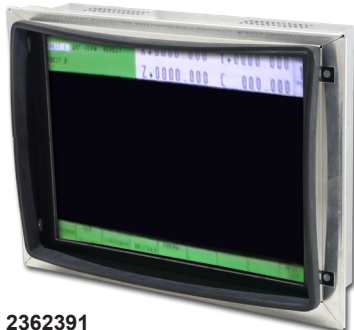
2362391 - Krümmungsadapter / Winkelsatz