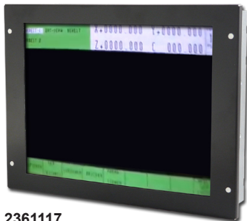
2361117 - Blende frontseitig / Winkelsatz