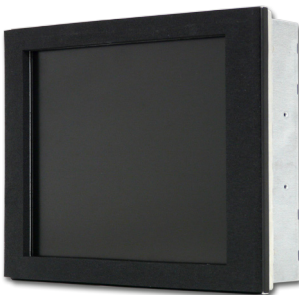
2364138 / 85-240V AC

Unser TFT-Industrie-Monitor ersetzt mit einem modernen Konzept ausgediente oder defekte 12.1" TFT / 14" CRT Monitore in AGATHON Maschinen.